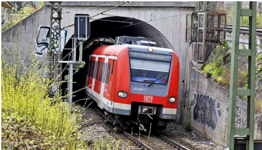
Eine S-Bahn kommt aus dem Tunnel am Ostbahnhof. Der Bau der 2. Röhre steht in den Sternen