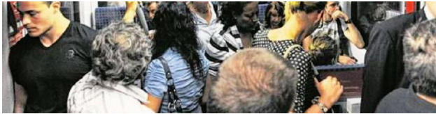
Immer voll: Gerade im Berufsverkehr drängen sich die Münchner in den S-Bahnen