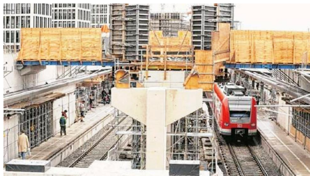
Dauerbaustelle Donnersbergerbrücke. Die meisten MVV-Nutzer sind genervt

1.) Die Kosten steigen und steigen: Im Jahr 2000 war von 537 Millionen Euro die Rede, 2007 waren es schon 1,8 Milliarden Euro. Jetzt geht die Bahn von 2,57 Milliarden Euro aus. Kein Wunder, dass der neue Bundes-Verkehrsminister Alexander Dobrindt (43, CSU) keine Bau-Garantie geben will.