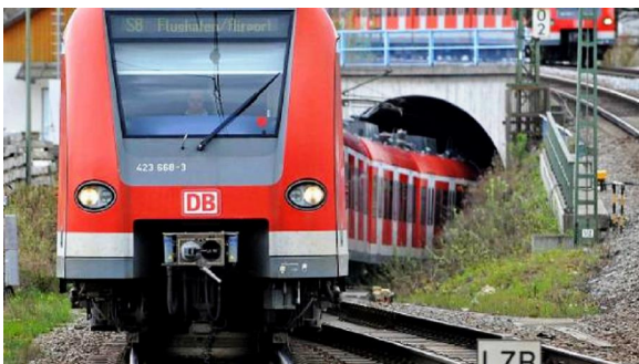
Eine S-Bahn kommt aus dem Tunnel. Die Stammstrecke muss dringend entlastet werden

Weitere Steigerungen seien zu erwarten: „Herrmann muss nun endlich die Reißleine ziehen und sich von dem Projekt verabschieden,“ fordert Ganserer.