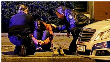
Junge Frau flüchtet schreiend aus