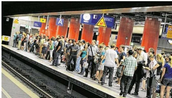
Rund 800 000 Fahrgäste nutzen täglich die Münchner S-Bahn

Kernstück ist ein 7,3 Kilometer langer Tunnel zwischen Hauptbahnhof und Ostbahnhof/Leuchtenbergring.