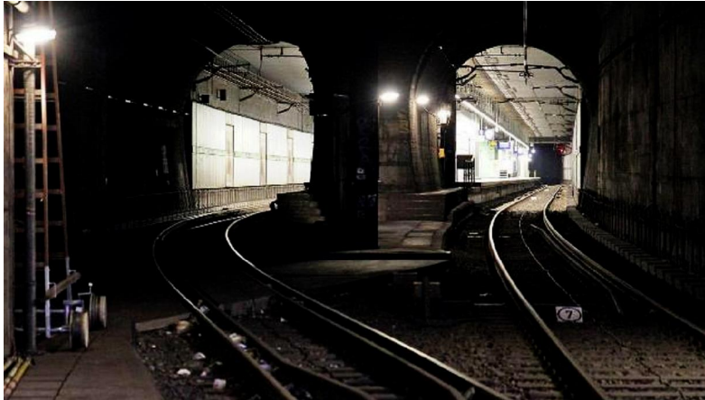
Guckt München endgültig in die Röhre?