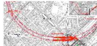
An der Grobplanung des Streckenverlaufes (Plan) wird sich nicht mehr viel ändern, glaubt Ingeborg Michelfeit von der Bürgerinitiative Tunnelaktion. Plan: DB

Haidhausen · Während der Urlaubszeit laufen die Planungen für die zweite S-Bahn Stammstrecke auf Hochtouren. Ab Montag, 30. August werden die Unterlagen zu den Baumaßnahmen im Planungsreferat öffentlich ausgelegt.