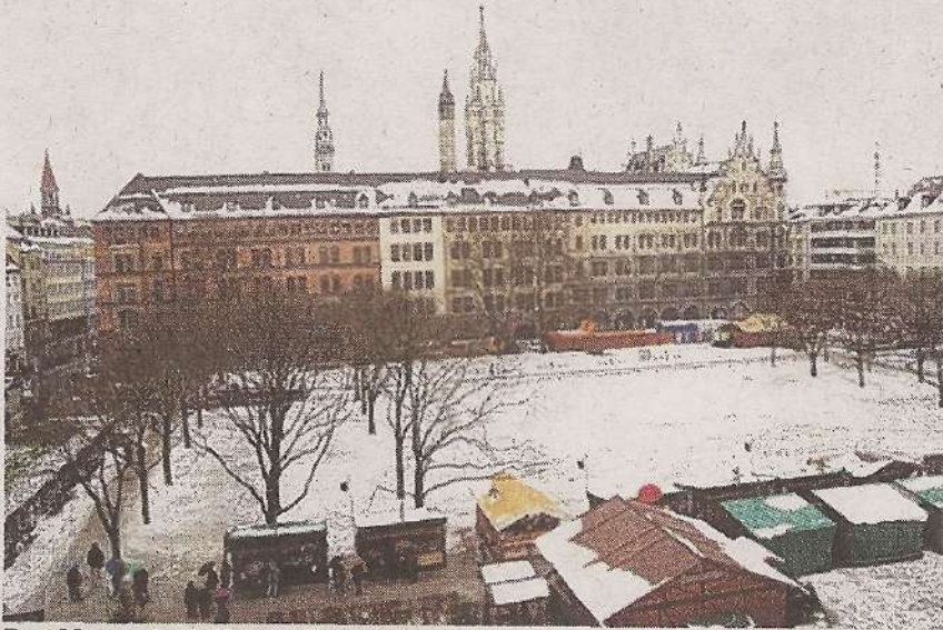
Der Marienhof: Hier soll fünf bis sechs Jahre gebaut werden. Die offene Baugrube soll 50 mal 60 Meter groß sein.

endler, Dallmayr, Gastronom Charles Schumann und Prinz Albert von Thurn und Taxis. Der Sohn von Fürstin Gloria besitzt dort ein Geschäftshaus.