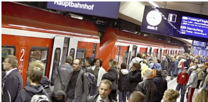
Die Münchner S-Bahn platzt aus allen Nähten. Während diese Erweiterungspläne Gestalt annehmen, ist München 21 beerdigt.

MÜNCHEN - Seit Stuttgart 21 ist klar, dass sich Projekte dieser Größenordnung nur unter größten Schwierigkeiten umsetzen lassen. München lernt das gerade bei seinen Plänen für einen zweiten S-Bahn-Tunnel. Dabei hätte es für die Stadt entschieden härter kommen können.